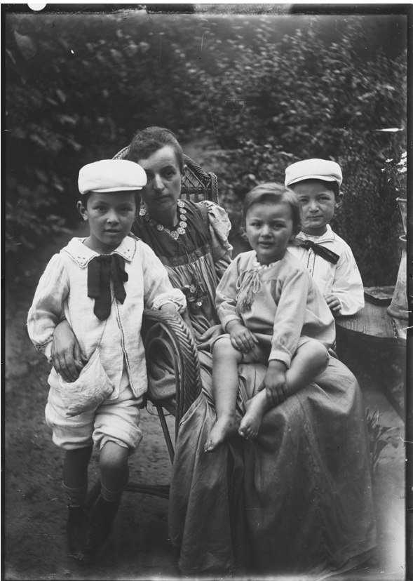
Willem Witsen, Betsy met de jongens buiten, Ede, ca. 1901 , Prentenkabinet (UB Leiden)